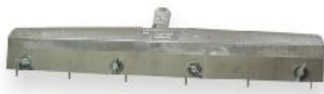
RAKLE S NASTAVITELNÝMI HROTY