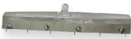
RAKLE S NASTAVITELNÝMI HROTY